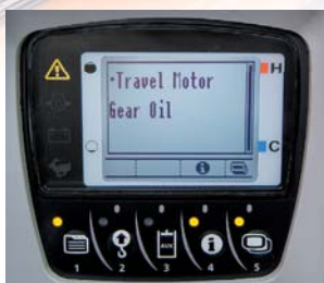
Service interval informatie